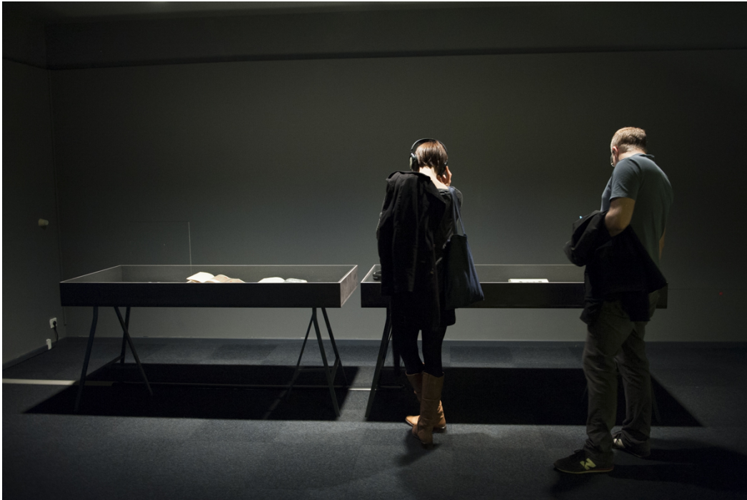
BesucherInnen bei der Eröffnung, Foto: Sebastian Bolesch