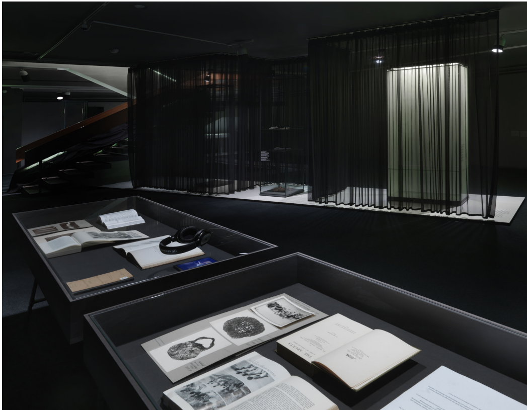
Ausstellungsansicht „[Offene] Geheimnisse“, Foto: Jens Ziehe