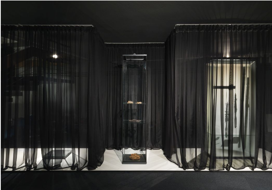
Ausstellungsansicht „[Offene] Geheimnisse“, Foto: Jens Ziehe